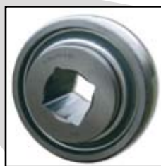
W 209 PPB25