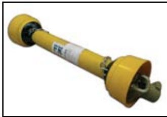
Univerzalni kardan 05B-740.10.10-10.10

- Namena: za prskalice, rasipače, mineralnog đubriva, sakupljač sena....