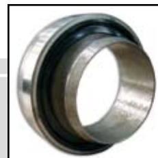
KZIZ - 5.2