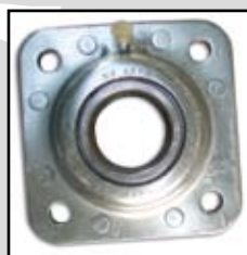
GWST 209 PPB12 (ST 491)