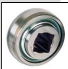
W 209 PPB30