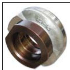
KZI 4,5-37 + NL 57

- Namena: za kamionski program (Mercedes, FAP, IMT)