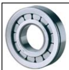
NUP 309 N.VH.C3

- Namena: za kamionski program (FAP i TAM)