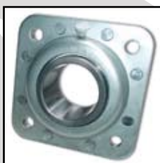
GWST 211 PPB15 (ST 740)