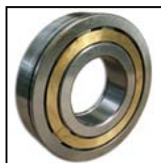
NUP 314 EN.M.C3