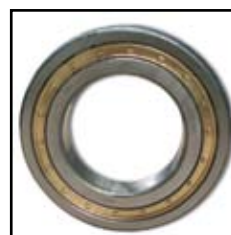
NUP 216 EM.R.C3

- Namena: za kamionski program (Mercedes, FAP, IMT)